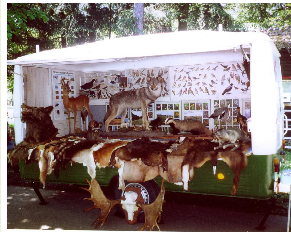
Das vereinseigene Info – Mobil wurde im Jahr 2003 erworben