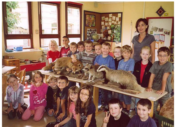
Für Rudolf Kutzke † war es eine Herzensangelegenheit bei jungen Menschen das Interesse an Natur und den darin lebenden Wildtieren zu wecken.