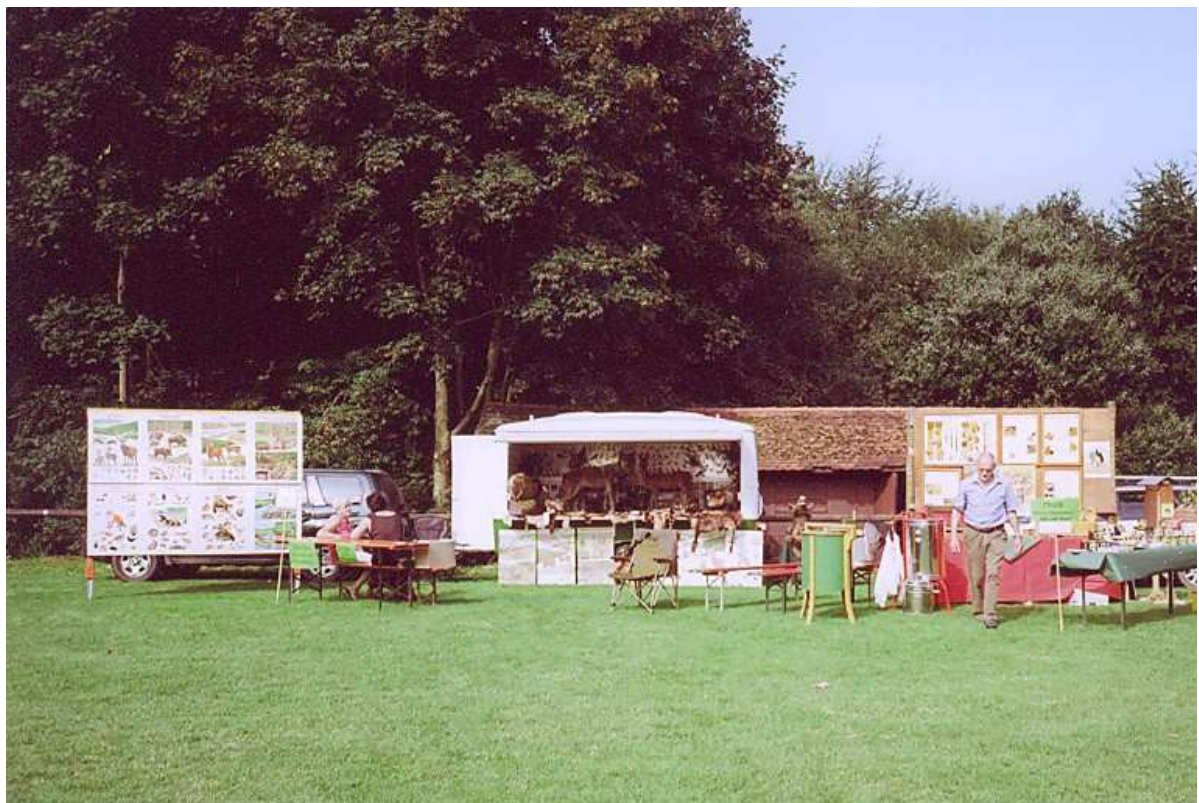
Das vereinseigene Info Mobil umrahmt mit vielen fachlichen Schautafeln bei einer Veranstaltung auf dem Acisbrunnen - Gelände in Schlüchtern