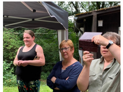
Der Vorstand des DTK Spessart Nord trug perfekt zum Gelingen des Bläsertreffens bei.