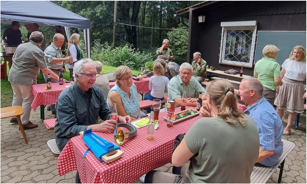
Freude über das Wiedersehen, dazu Muse und Zeit zu Gesprächen über jagdliche Neuigkeiten und jagdpolitische Themen füllten den Nachmittag aus, der mit Hörnerklang und dem Jagdmusikstück „Auf Wiedersehen“ endete.